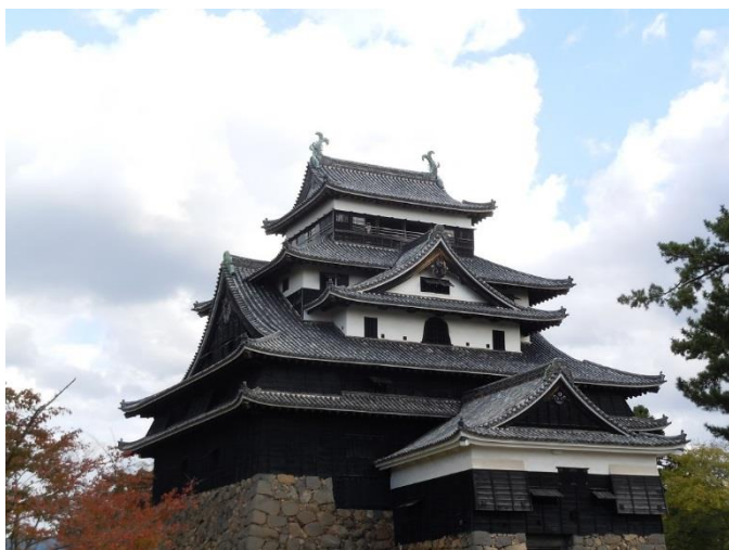
(写真は、松江城です)