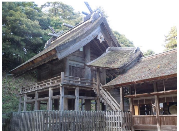
(写真は、神魂 (かもす) 神社です)

*14 日の衆議院選挙の投票が終わらないとご紹介した内容の議論が前に進んでいかないでしょうが、日本経済が微妙な時期だけに選挙後のすばやい対応を望むばかりです。