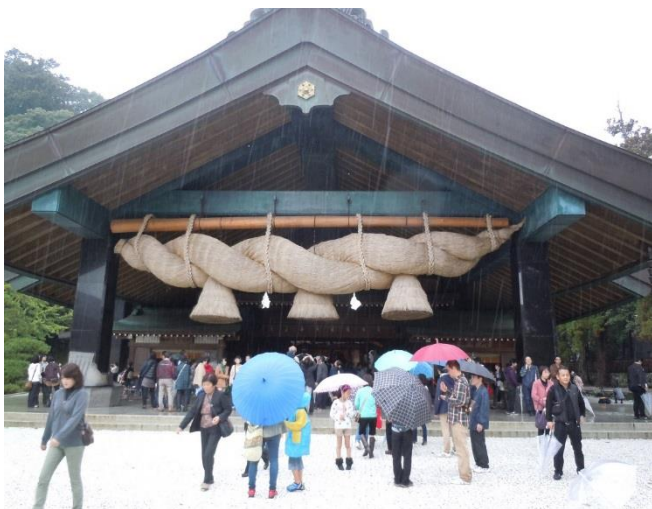
(写真は、出雲大社で撮影しました)