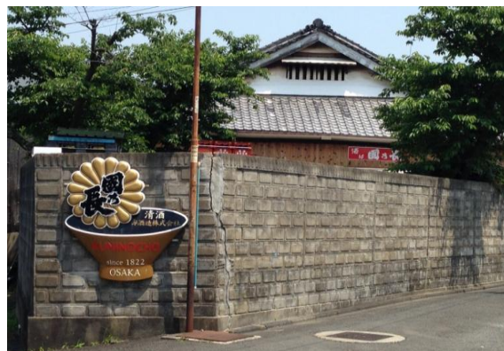
(高槻市富田にある寿酒造さん)

どうい所で酒やビールが造られているのか興味があるので、また別の酒蔵に機会があれば出向いてみたいと思っております。