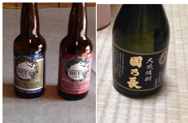
(左が地ビール 右が酒粕で造られた焼酎)