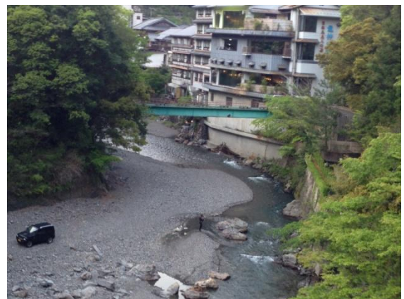
(写真は、龍神温泉です)

* 政府が今月にまとめる経済財政運営と改革の基本方針(骨太の方針)で詳しい内容が提示されますので、詳しい内容が分かり次第、取り上げさせていただきます。