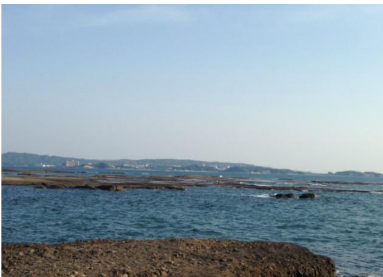
(写真は、和歌山県田辺市の天神崎です)