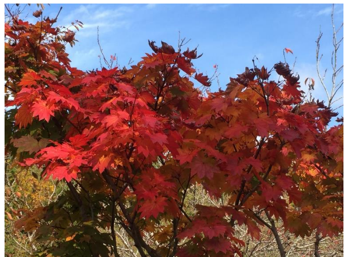
(写真は、光明寺墓地公園の紅葉です)

*許認可申請が必要な事業承継は手続きに時間がかかりますので、この改正が早く決まっていただくことを願います。