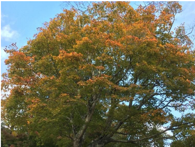
(写真は、光明寺墓地公園の紅葉です)

今月は、神戸市北区にある光明寺墓地公園に紅葉狩りに行った際に撮影した写真を掲載いたします。