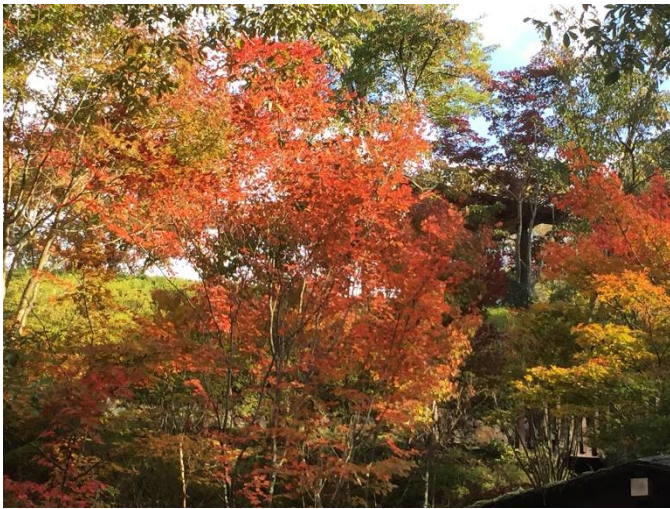
(写真は、光明寺墓地公園の紅葉です)

* 控除額の詳細な一覧表につきましては、参考文献の「平成 30 年分 年末調整のしかた」をご覧ください。