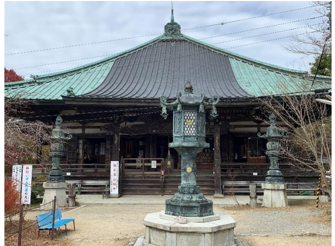
(写真は、施福寺の本堂です)