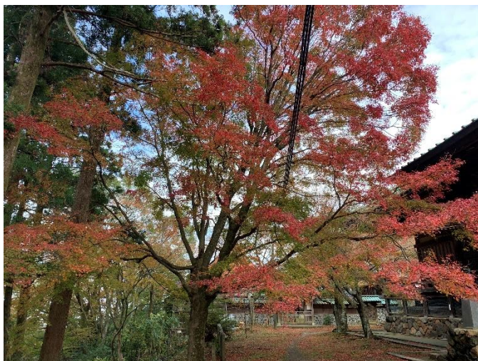
(写真は、施福寺の境内です)