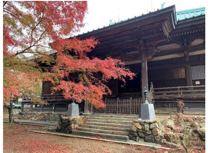
(写真は、施福寺の境内です)