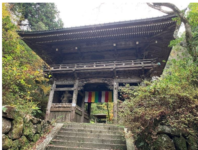
(写真は、施福寺の山門です)

今月発行の事務所便りの内容としましては、税金よりのピックアップとしまして、 令和2年分の年末調整について その2、新型コロナウイルス感染症拡大防止への対応と申告や納税などの当面の税務上の取扱いに関するFAQ について その2