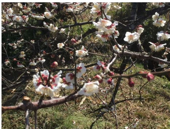
(写真は、南部梅林で撮影した梅の花です)

今月発行の事務所便りの内容としましては、税金よりのピックアップとしまして、 R5年分の確定申告 について、 電子帳簿保存法改正 について その6 を書いております。