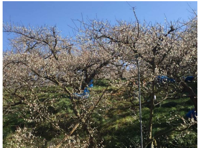
(写真は、南部梅林で撮影した梅の花です)