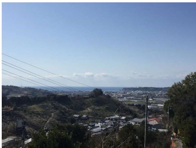
(写真は、南部梅林からの眺望です)

申告書を作成する場合には、2割特例を選択適用した方が納付税額が少なくなるのかどうかを検討していただく必要があります。