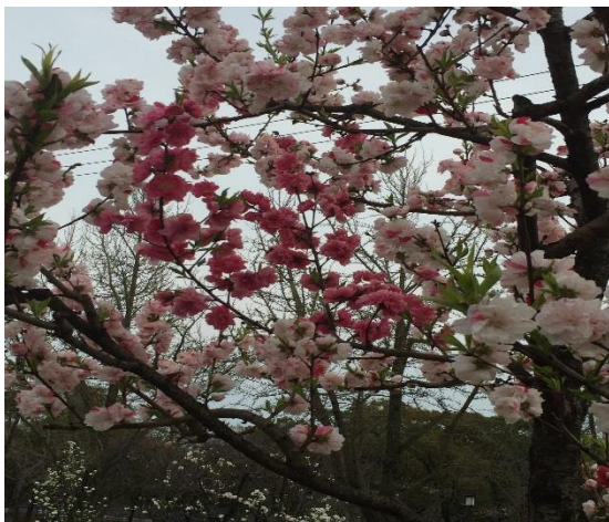
(写真は、大阪城にて撮影した桃の花です)

あと給与ソフトにて源泉徴収票を作成してご本人に源泉徴収票をお渡しする場合には「受給者交付用」を印刷するようにお気をつけください。