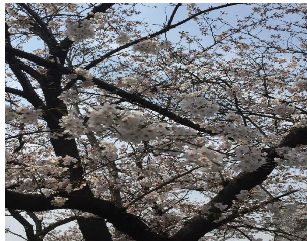
(写真は、猪名川沿いの桜です)

*消費税増税が予定通りに来年4月から実施されるかどうかは分からなくなってきましたが、軽減税率対応のレジの導入を考えられている事業者さんはこの補助金を利用されるべきです。代理申請が可能になるとのことなので、レジメーカーに申請についてお聞きになられてみてはいかがでしょうか。