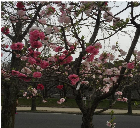
(写真は、大阪城にて撮影した桃の花です)

今月発行の事務所便りの内容としましては、税金よりのピックアップとしまして、 マイナンバー制度について その8 、 最近の税務関連状況 、税金以外のテーマとしまして 病気から身を守る酵素パワー その1 を書いております。