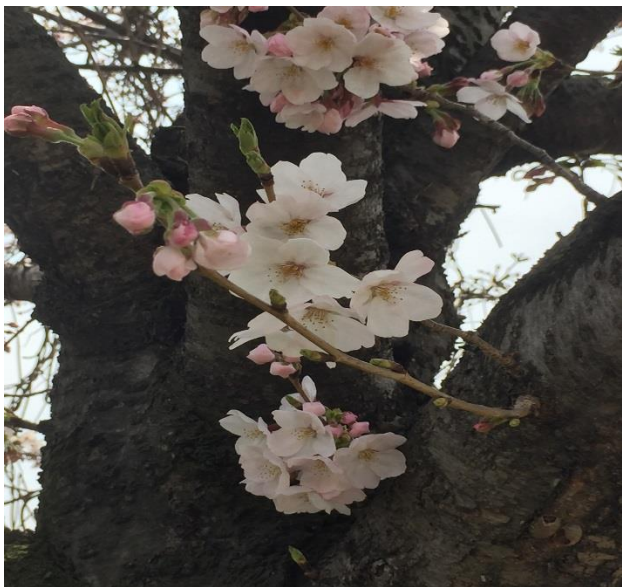
(写真は、猪名川沿いの桜です)

これまでに保有している固定資産にではなく、これから購入する固定資産にこの税率が適応されることとなります。