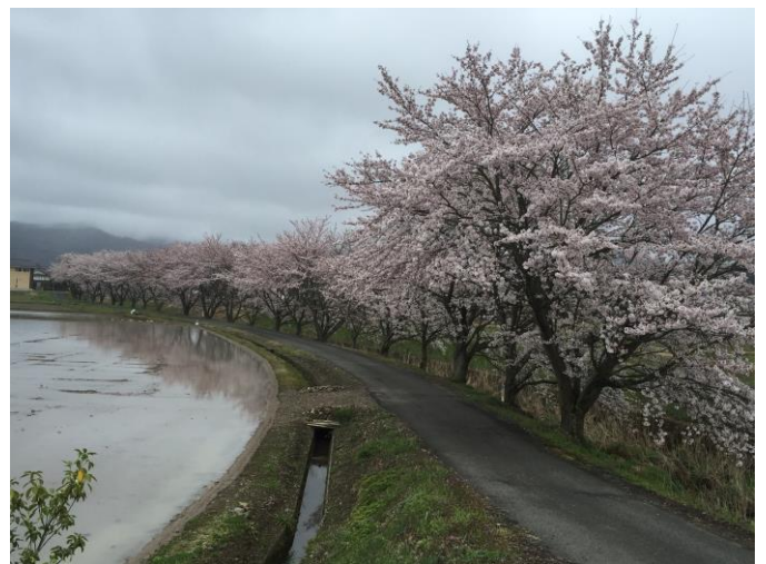
(写真は、篠山で撮影した桜です)

*法人と従業員5人以上の個人事業主は、法律で厚生年金と健康保険に加入しないとイケないのですが、業績が悪くなり雇用を維持するために厚生年金と健康保険を脱退した法人や個人事業主さんもいらっしゃいますので、再度加入することになって業績が悪くなり、従業員数を減らすことにならなければいいのですが。