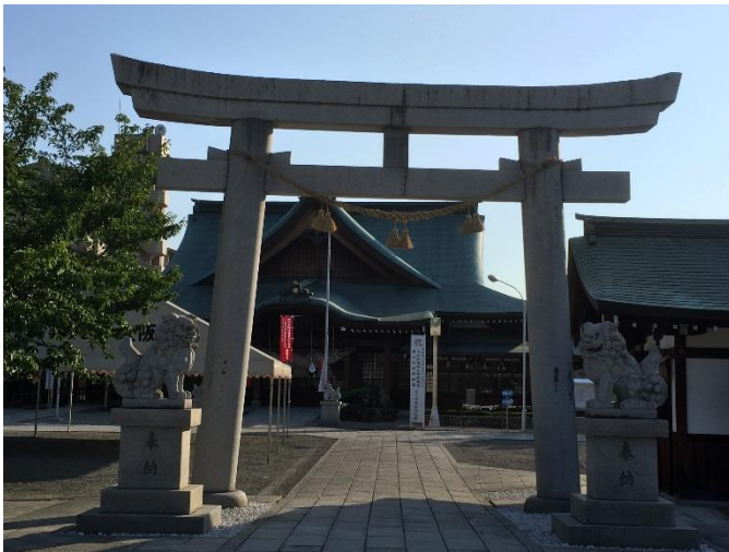
(写真は、出雲大社の大阪分祀です)

今月は、大阪府堺市にある出雲大社の分祀を参拝に行った際に撮影した写真と須磨水族館で撮影した写真をご紹介します。