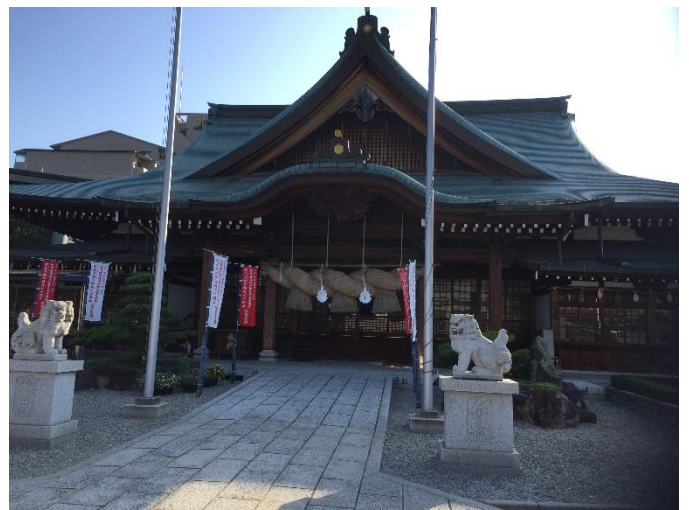
(写真は、出雲大社の大阪分祀です)

先月号では「印紙税の納税義務者」「非課税文書・不課税文書」「課税文書の種類」などをご説明させていただきました。今月はそれ以外の内容についてご説明させていただきます。