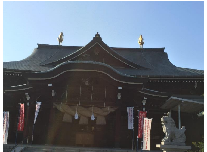
(写真は、出雲大社の大阪分祀です)