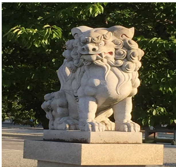
(写真は、出雲大社の大阪分祀です)